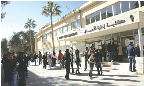
كلية إدارة الأعمال

قدمته المجموعة لإبرام هذه المذكرة مشيراً إلى أنه بمقتضاها يتم التخفيف على الجامعة نفقات مالية.