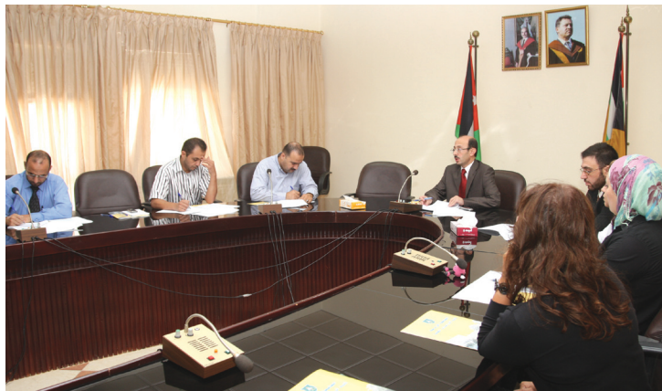
من المؤتمر الصحفي

فيه مسار الرسالة باستثناء تخصصات الفيزياء الطبية والنوية والمنافسة والتنظيم التي مازالت تعتمد مسار الامتحان الشامل. وأشار إلى أن هناك شروطاً جديدة لاجتياز امتحان التوفل لهذا العام بحيث يكون ٤٠٠ علامة كحد أدنى في التخصصات الإنسانية و ٥٠٠ علامة في التخصصات العلمية ٥٥٠ علامة للغة الانجليزية