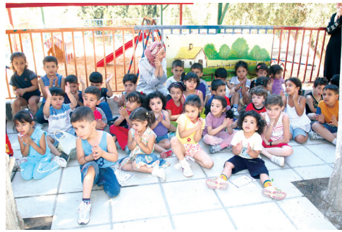
أطفال حضانة وروضة الجامعة